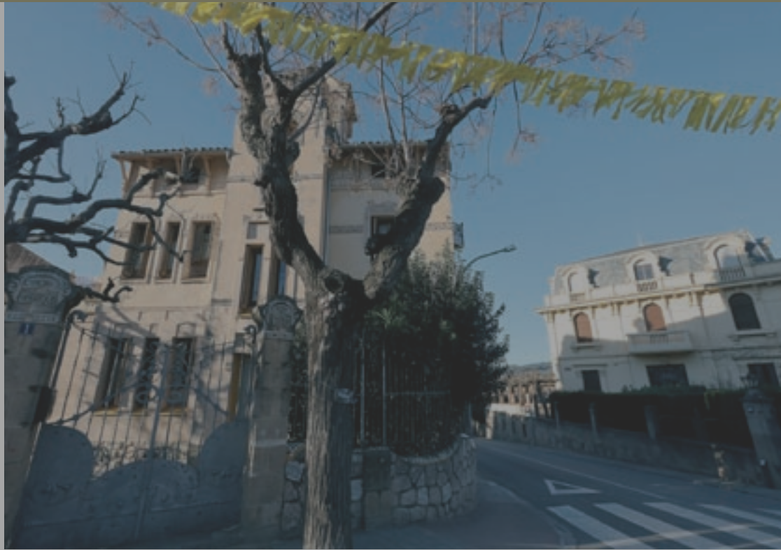
El patrimoni modernista de la Garriga és un dels atractius turístics que destaca la guia del Consell Comarcal

La guia convida a fer visites de curta distància i posa en valor tot l'atractiu turístic de la comarca, des de la natura fins al patrimoni cultural, passant pel termalisme, la gastronomia, el cicloturisme, l'enoturisme o el turisme de compres, entre d'altres. Dins de cada ruta també s'hi proposen allotjaments, restaurants i comerços per informar al visitant sobre tots aquells serveis que té al seu abast durant l'estada. Cada ruta inclou enllaços directes