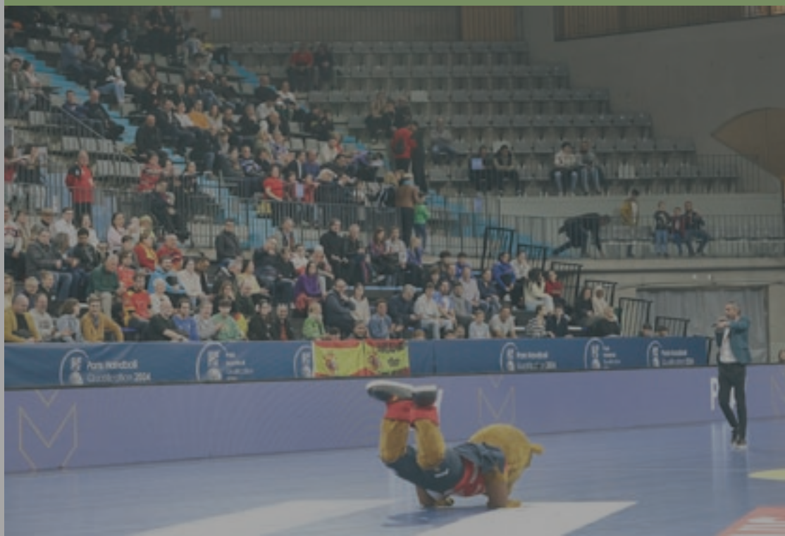
La Lola, mascota de la Selecció, i l'"speaker" animaven una acolorida graderia del Palau que tenia alguns espais buits