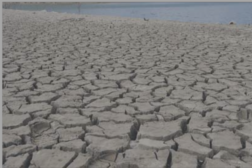
Imatge de falta d'aigua al pantà de Susqueda ■ JOAN CARLES CODOLÀ

Barrejo deliberadament la frase d'un anunci de la Generalitat amb motiu de la sequera i el títol d'un programa de TV3 sobre aquest tema, que es va emetre fa uns quants dies. Ho faig perquè em sembla que hi ha una certa desorientació a l'hora d'afrontar un problema que afecta gairebé tota la població i molts sectors productius. Alhora, soc conscient que posar-me a parlar d'un tema tan delicat com és l'aigua és posar-me a les carxofes. Tanmateix, ja que hi som, parlem-ne.