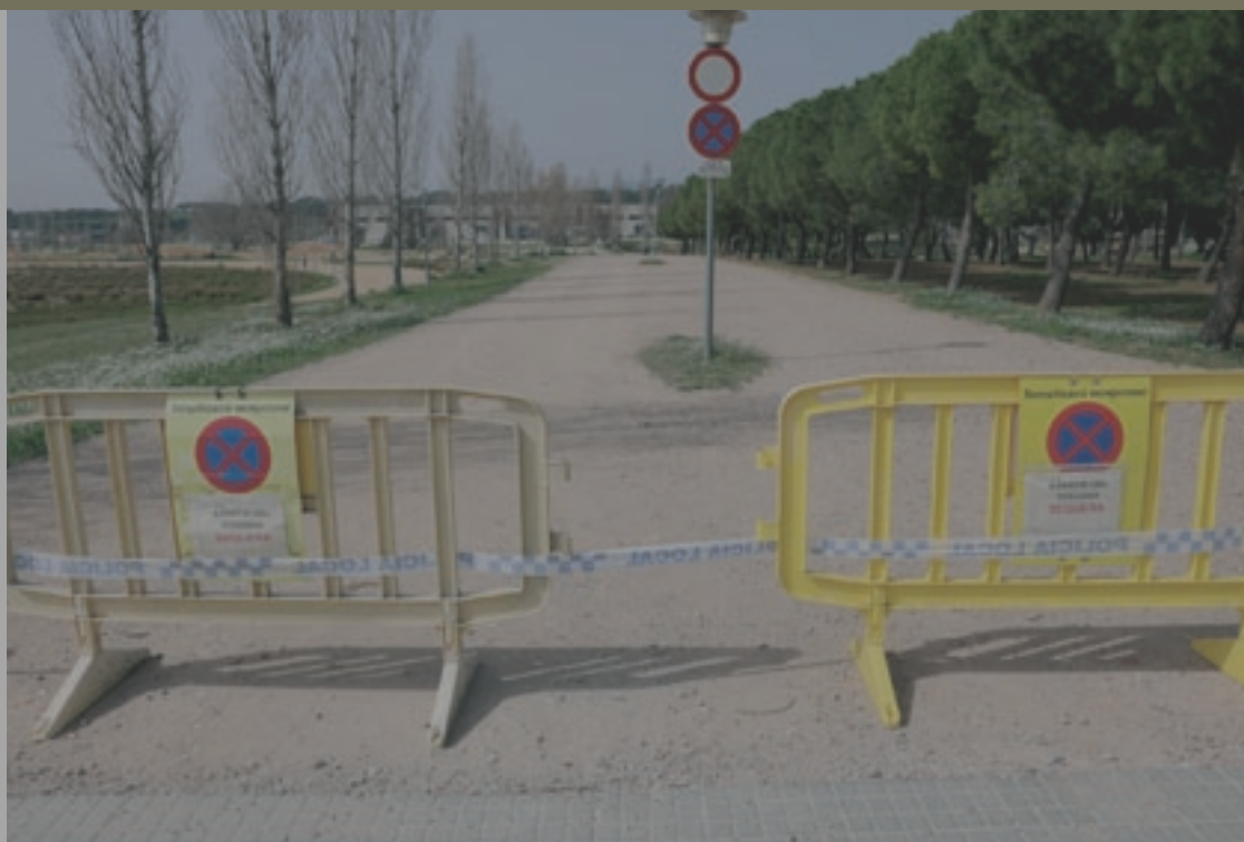
El tancament de l'accés des de l'antiga N-152a, a la zona de Can Terrers