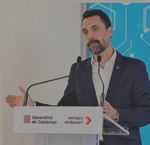
Roger Torrent, ayer, en la presentación de la línea de subvenciones.

Respecto al agua, el nuevo criterio de valoración para la concesión de las ayudas consiste en acreditar que el proyecto industrial asegure una